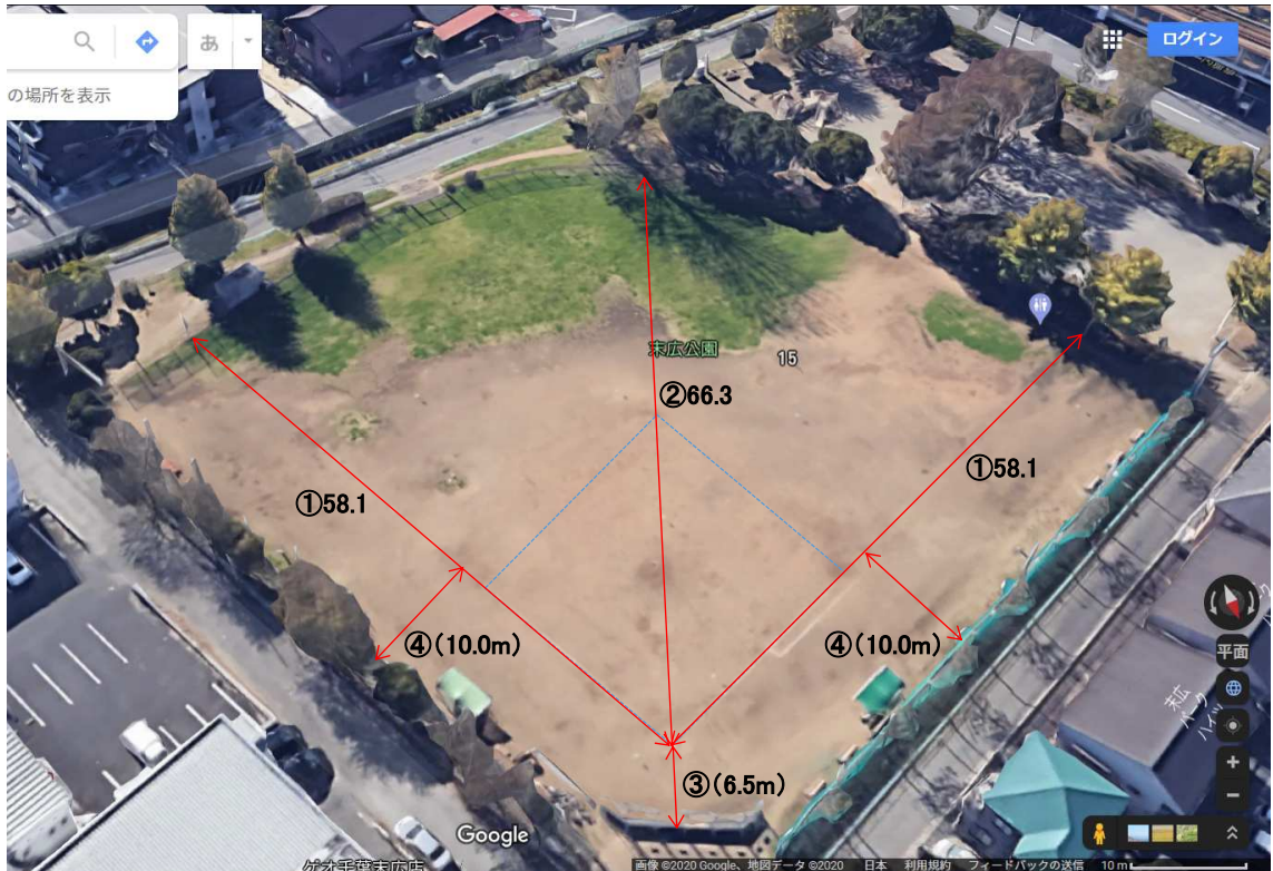
図:グラウンド概観、フェンス等各設備配置、仕様